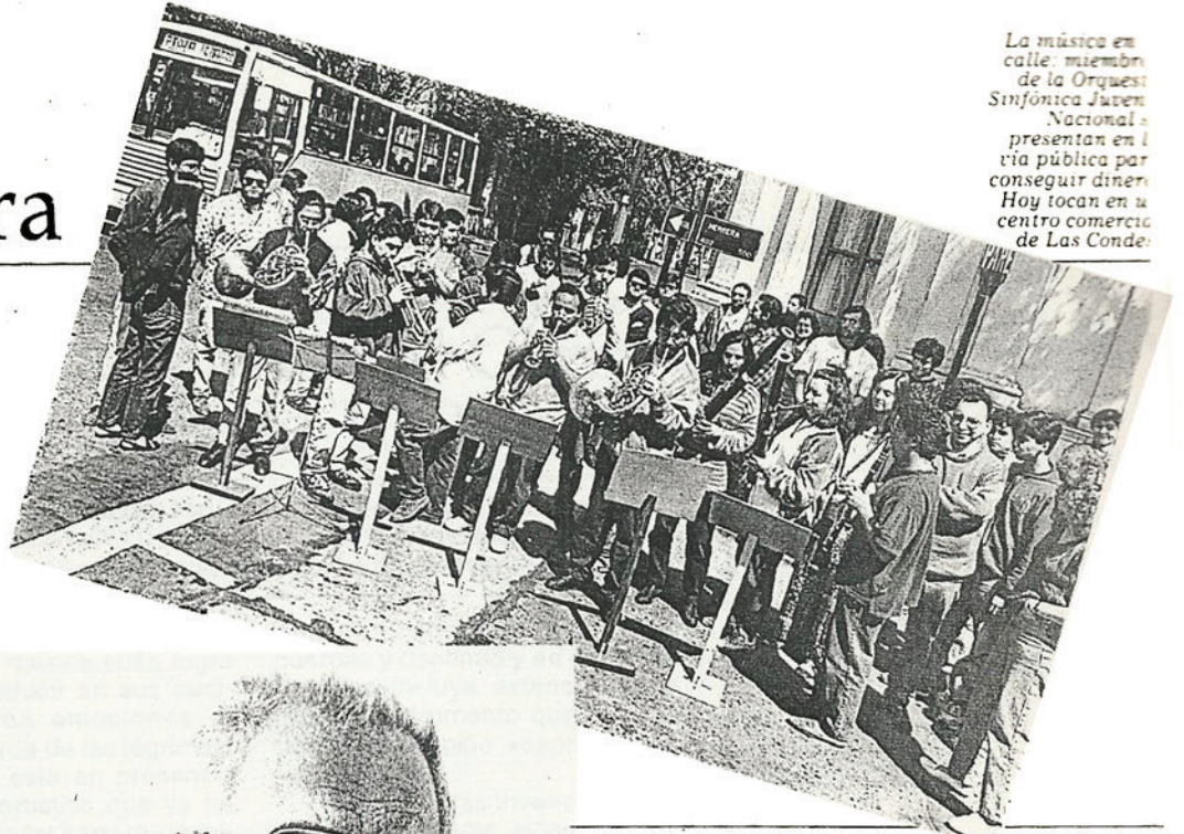
La música en calle: miembros de la Orquesta Sinfónica Juvenil Nacional se presentan en la vía pública para conseguir dinero. Hoy tocan en un centro comercial de Las Condes.

A NUALMENTE en todo Chile se gasta en música cerca de 10 millones de dólares. No es mucho si se considera que con esa cifra se alcanza a cubrir, apenas, las necesidades básicas de una sola orquesta sinfónica en un país desarrollado. Menos, si se expresa como gasto per cápita: no llega a un dólar anual por habitante.